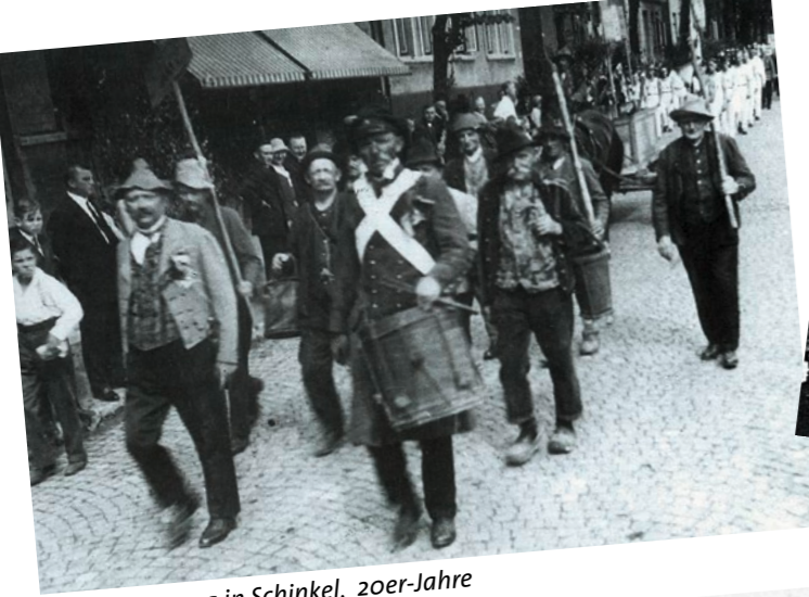
Schützenzug in Schinkel, 20er-Jahre