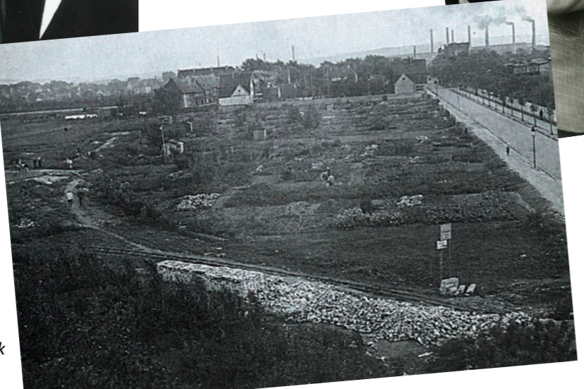
Oststraße, 1930. Im Hintergrund das Stahlwerk