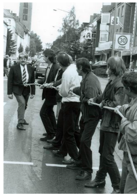
Ernst Schwanhold im Bundestagswahlkampf 1994 auf der Schützenstraße