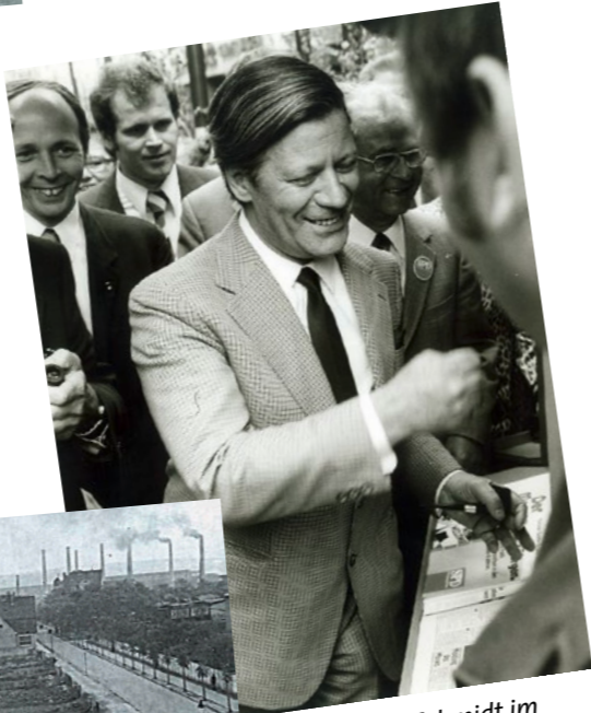
Helmut Schmidt im Wahlkampf 1978. Unten rechts: eine Ausgabe von „Unser Schinkel“