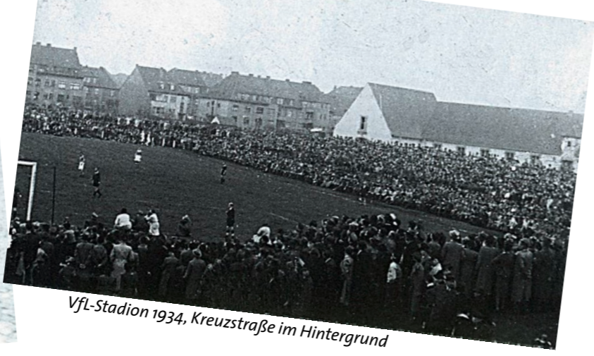
VfL-Stadion 1934, Kreuzstraße im Hintergrund