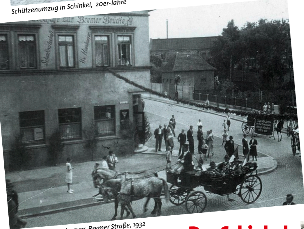
Gaststätte Hügelmeyer, Bremer Straße, 1932