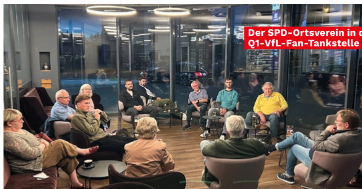
Der SPD-Ortsverein in der Q1-VfL-Fan-Tankstelle